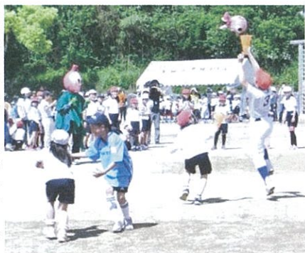
地域のゆるキャラ「いちじくん」も応援

子ども会オリジナルの種目にみんなが白熱し、地域の仲間との絆を深めることができました。