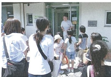
「子ども110番の家」の方と挨拶を交わす、子ども達