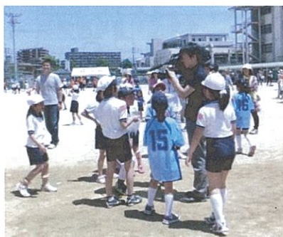
取材のカメラに興味津々