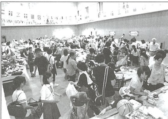
昨年のバザー会場