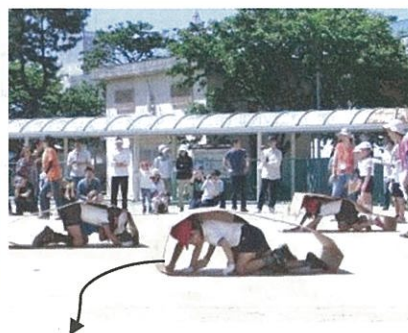
ダンボールで作りました