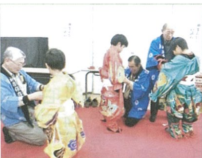
この日の一番のお楽しみ 実際に神楽の衣装を試着