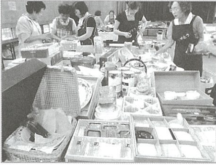
相談しながら値段をつけていきます