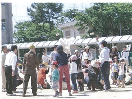
幼児と来賓の玉入れ