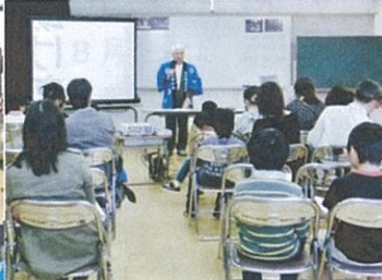
神楽のお話を聞き、 ビデオで神楽をみました 太鼓や調子金を打ちました